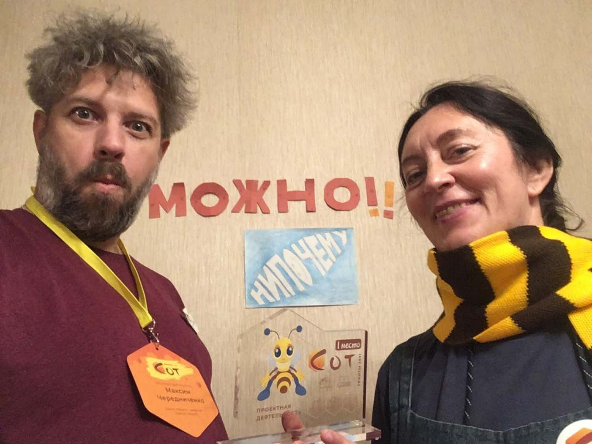
Обучение смене ролей и позиций на уроках литературы в подростковой Монтессори-школе